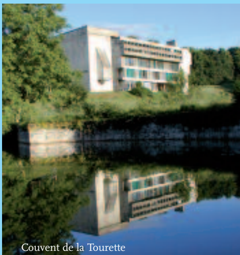
Couvent de la Tourette